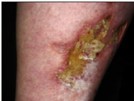
FIGURA 1. Úlcera con fondo necrótico en el dorso del pie e infartos por embolia distal.