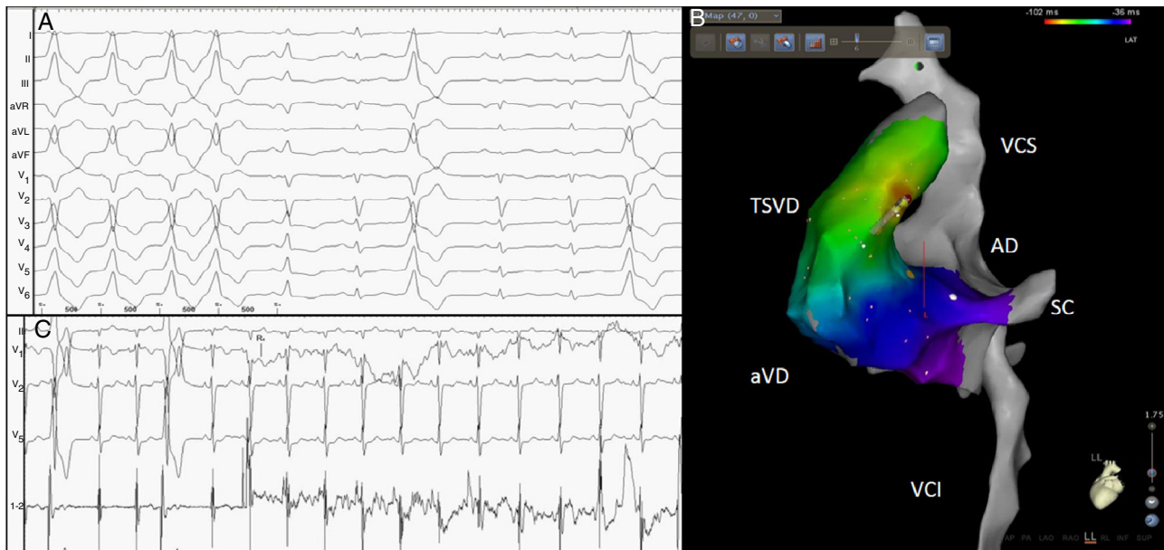
Figura 3 – Paciente con EV frecuente asociada a DVI (panel A). Se realizó cartografía electroanatómica comprobándose foco de origen en el TSVD posteroseptal (panel B). La ablación en dicha zona suprimió la EV a los pocos segundos (panel C). TSVD: tracto de salida del ventrículo derecho; aVD: ápex de ventrículo derecho; VCI: vena cava inferior; SC: seno coronario; AD: aurícula derecha; VCS: vena cava superior.

del 99%) para predecir la retirada del implante del DAI en los pacientes tratados con ablación 17 . Por tanto, dado el favorable perfil de riesgo/beneficio de la intervención, creemos que la ablación con catéter es una terapia de primera elección en pacientes con DVI, inducida o empeorada por la carga de EV, independientemente de la sintomatología.